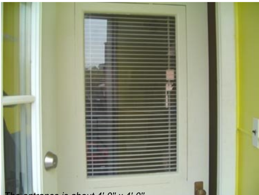
The entrance is about 4' 0" x 4' 0"