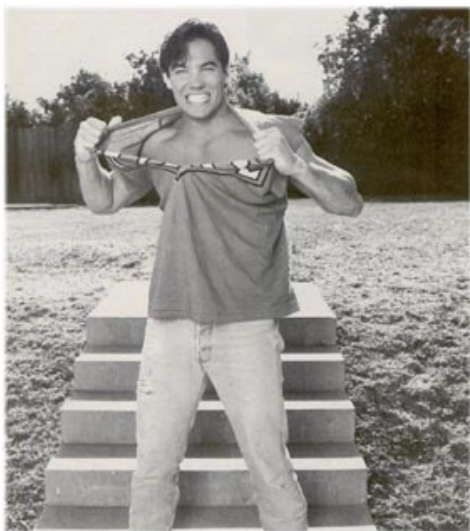
Cain prend sa soudaine